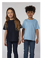
SOL'S Imperial KIDS 11770