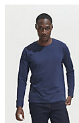
SOL'S Imperial LSL MEN