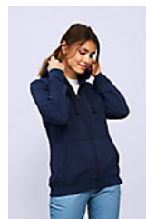
SOL'S SPIKE WOMEN 03106